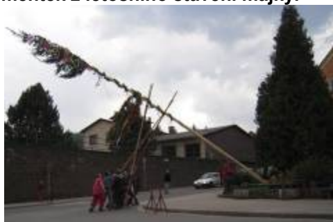
Boj s 16 m dlouhou májkou začíná.