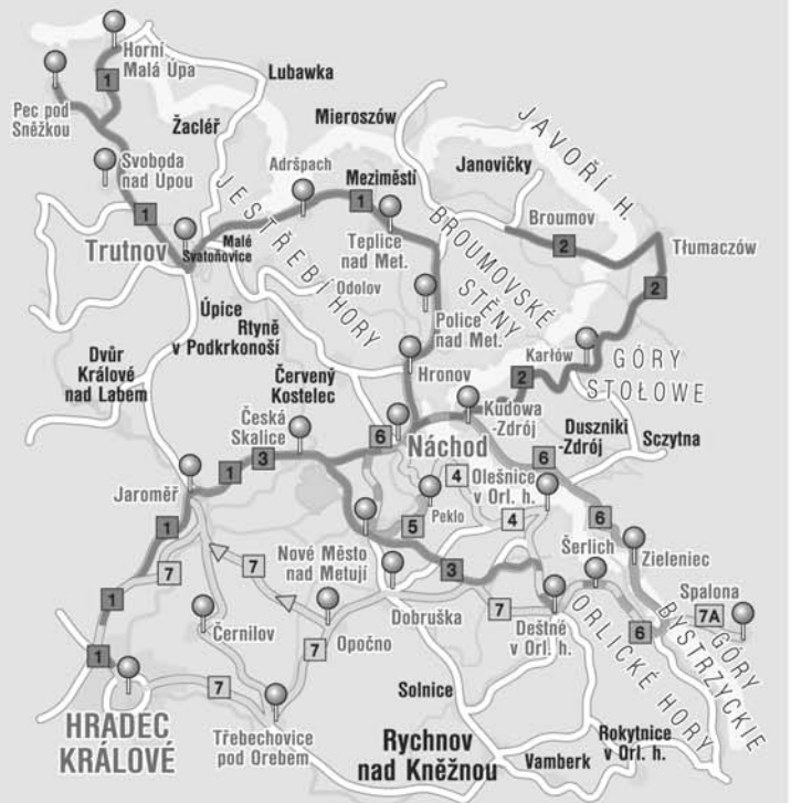
Foto a grafický design Miloš Kaválek, Predtisková příprava a tisk Reklamní studio Kazi.