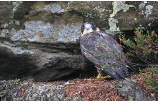
Letošní sokolí mládě první den po výletu při odpočinku během deště.

kterí omezení respektovali a nepřímo tak pomohli ochraně tohoto vzácného tvora.