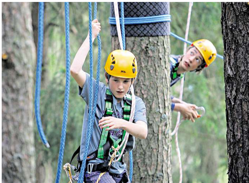
Lanové centrum Přímou u Adšpašského skalního města si zájemci s dětmi od šesti let mohou vyzkoušet odvahu na překážkách v lanovém centru. Mají tu lezeckou stěnu, nízké překážky i visuté lávky.

Další lanový park vznikl u táborové základny na Janovičkách v Javořích horách u Broumova. Zájemci si tam mohou objednat návště-