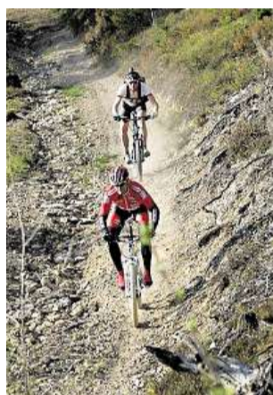
Kolaři si už Broumovsko našli.

Cyklobusy: jízdni řady na www.kladskepomezci.cz