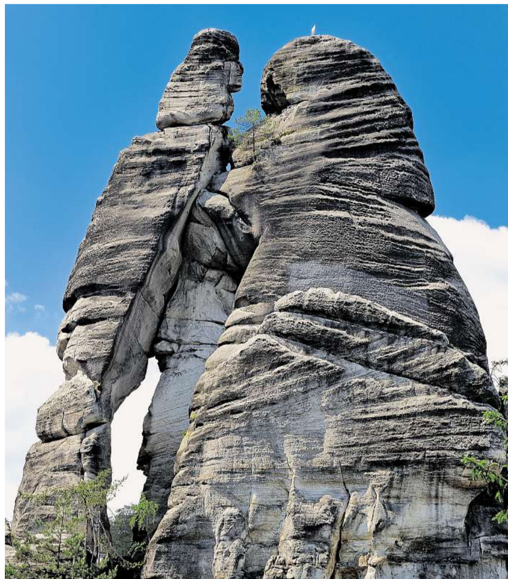
Milenci Nejznámější skalní útvar Adršpašsko-teplických skal.

Prohlídka sousedních Teplických skal si žádá větší zdatnost, protože obnáší skoro šestikilomet-