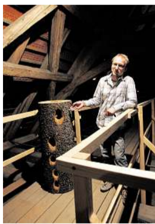
Zámecká půda v Novém Městě.

Nedaleký empírový zámek v Ratibořicích je s náchodským panstvím a jeho majiteli těsně spojen. Je zná-