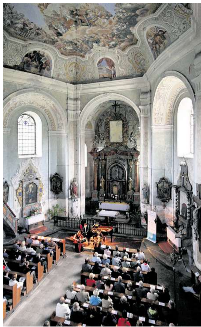
Za poklady Broumovska Letos bude 7. ročník.

V tom je ta věda. Já jsem s kolegy přesvědčen, že hlavní je snaha o přátelskou atmosféru a kvalitu. Cestou k tomu je komunikace. Být v kontaktu s poskytovateli služeb v cestovním ruchu, obcemi, profesními sdruženími a diskutovat aktuální kvalitu naší a dalších destinací. Zároveň je třeba podporovat aktivní lidi a instituce v projektech, které mohou být příkladem dobré praxe, a následně je to informovat. Kvalita služeb je