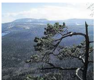
Polská Hejšovina.

Poláci tu vyhlásili národní park a skály berou jako velkou atrakci, takže na Hejšovinu a do Bludných skal ročně míří 150 tisíc lidí. Turistickým východiskem je planina s osadou Karlów, kde se nacházejí velká parkoviště, rekreační domy, asi deset restaurací, barů, řada stánků se suvenýry nebo domácím tvarem. K nim před pár lety přibyl i dinopark pro děti. Kdo se chce vyhnout návalu, musí vyrazit na Hejšovinu brzy dopoledne. Cestu po opravených Starých schodech s 682 stupni zvládnou dobře i děti, převýšení je asi 100 metrů. Na hoře se dá občerstvit v horské boudě, kterou tu vystavěli roku 1845 po švýcarském vzoru. Za chatou pak začíná placený okruh po skalním labyrintu, odkud se jednosměrnou stezkou prochází mezi bizarními skalami k opraveným vyhlídkám na okraji. Nejvyšším místem plošiny je Krakonošův trůn, nejstudenějším místem je Pekličko sevěrně skalami v délce asi sto metrů, kde se sníh udrží často do půli června. Zdejší zajímavostí je rys ostrovid, jež tu letos prvně vyfotografovali. Na Karlów jezdí víkendový cyklobus z Náchoda, o prázdninách pojede denně. (tů)